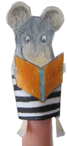
Illustration und Entwurf von Helga Bansch